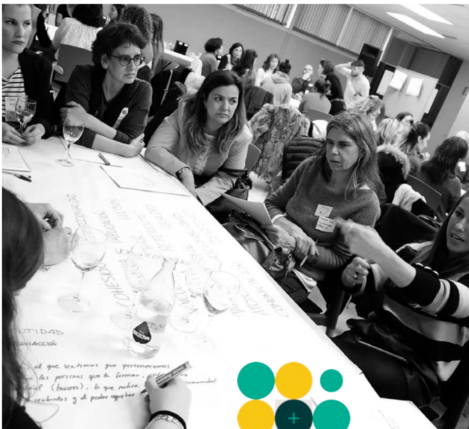
Participantes Plataforma VIDAS

FEMP y corporaciones locales: la cooperación con las entidades locales se realizará mediante la colaboración y el desarrollo de acuerdos o convenios para la puesta en marcha de iniciativas orientadas a la desinstitucionalización, en coherencia con la transición que propone la Estrategia.