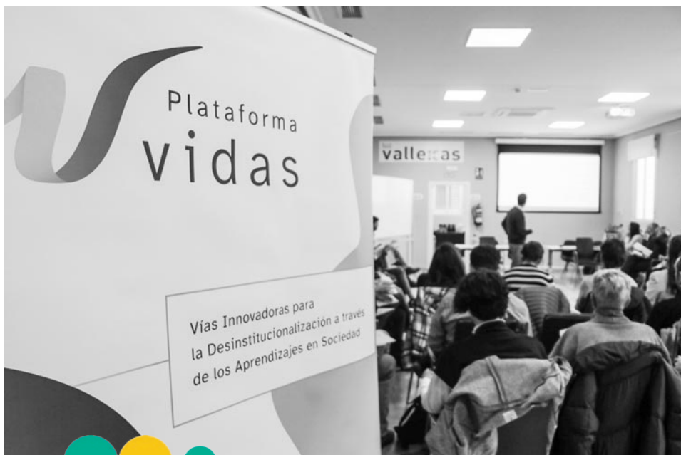
Jornada Plataforma VIDAS