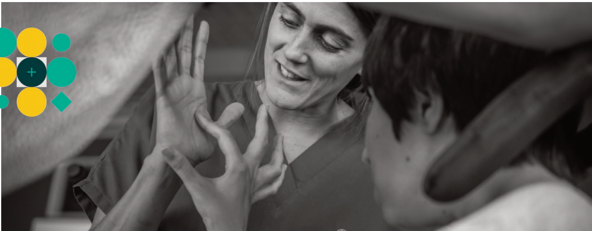
Volviendo a ser yo. Imagen extraída del Concurso de Fotografía Digital del INICO 'Las personas con discapacidad en la vida cotidiana'. Premio Fundación Aliados por la Integración. Autor: Alejandro Delgado

20,1% del conjunto de la población (9.527.262), representará el 25% en 2035 (12.881.952 personas) y el 30% en 2047 (15.841.916 personas). Las personas de 80 años y más, representarán el 26,9% de la población general en 2065, alcanzando la cifra de 10.120.175, de acuerdo con las proyecciones del INE. En este sentido, esta Estrategia hace hincapié en el importante valor social que realizan las personas que cuidan, principalmente mujeres, proponiendo líneas de actuación orientadas a valorizar la labor de cuidados, a mejorar las condiciones laborales y la protección social de las personas cuidadoras y a generar servicios y apoyos concretos para evitar que el cuidado recaiga sobre las mujeres y las familias.