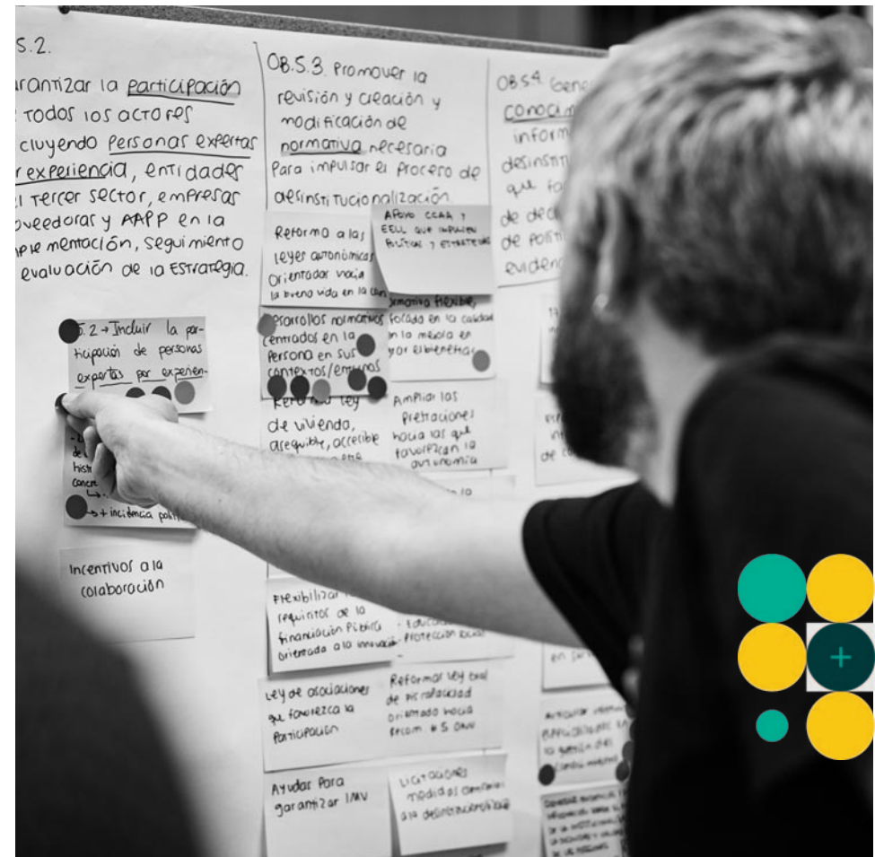
Sesión diseño estrategia