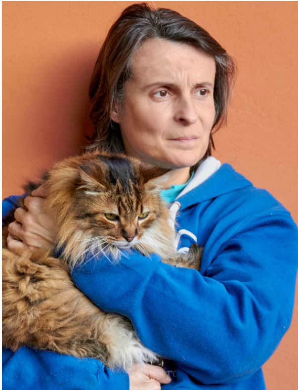
Mier aboga por no juzgar a los que devuelven un animal.

En cuanto a la familia, si es un buen hogar, simplemente no el adecuado para ese animal, se trata de quitarles la culpa de encima. Hemos romantizado las relaciones tóxicas con nuestros animales: las buenas personas tragan carros y carretas pero se quedan juntas... Incluso he llegado a escuchar como una mujer era toda una heroína porque tenía dos perros, cada uno encerrado en una habitación, sacándolos a turnos, que si se abría una puerta había una desgracia, pero no se "deshacía" de ninguno. Lo siento, pero no lo veo así. Tenemos que ser más racionales y tener claro que uno de los perros tiene que salir de esa casa. Una situación de tanto peligro, estrés crónico... no nos puede parecer aceptable en el tiempo y mucho menos heroica.