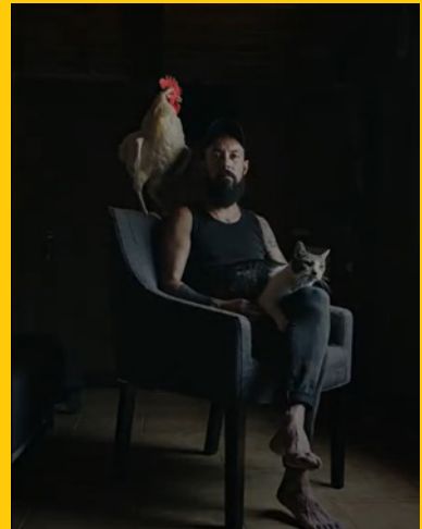
Algunas de las fotografías que componen la serie 'Retratos de familia'.