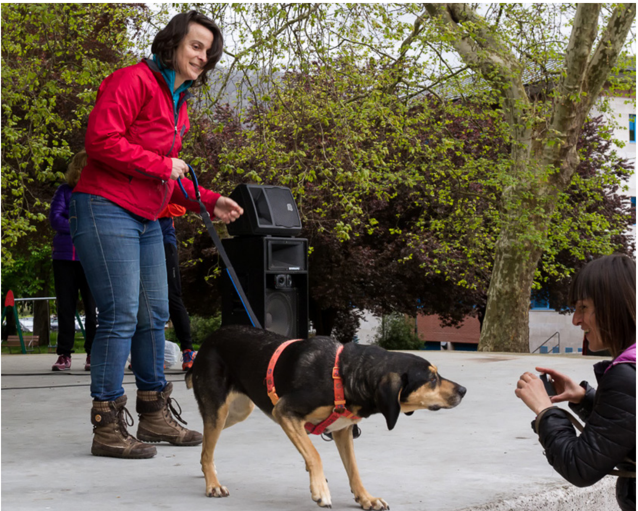
Los cuidados de estos perros incluyen un gran trabajo sobre su comportamiento y socialización, buscando siempre su bienestar.

Por lo que me toca, nuestra evolución es más que positiva, siempre hemos considerado que es un proyecto transversal, de ciudad, y tenemos un programa de formación con los colegios que está funcionando muy bien, visitas de diferentes colectivos en riesgo de exclusión social e incluso contamos con el apoyo, por ejemplo, del Real Oviedo y, de hecho, nos invitan a participar en más eventos y charlas de las que tenemos capacidad de asumir. Ser un centro cercano a la comunidad es una clave para el éxito.