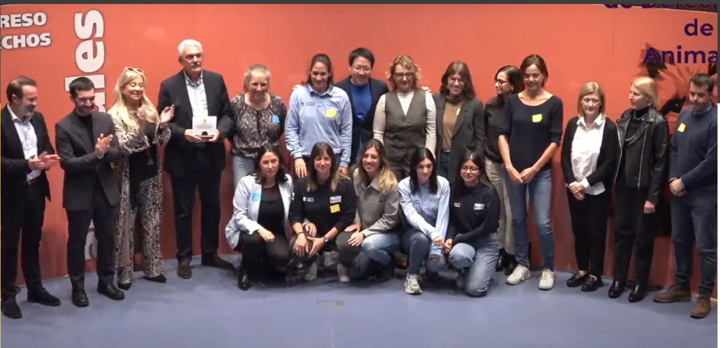
Miembros de los equipos del programa de colonias felinas del Ayuntamiento de Madrid, en la entrega del premio.