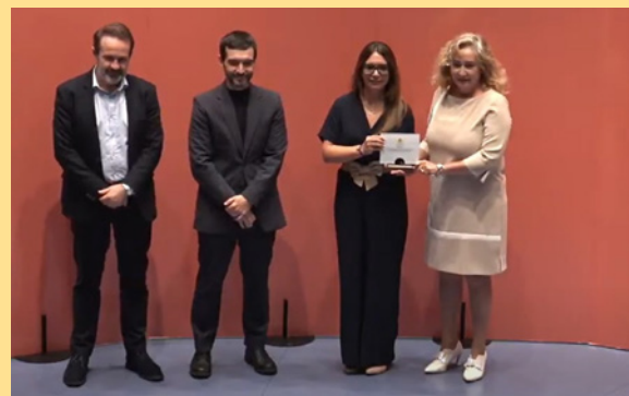
La alcaldesa de Rivas Vaciamadrid agradeció el premio en nombre de todos los vecinos de la ciudad.