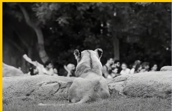
'Salvajes: el lado erróneo de la reja', de Andrés López Moreno.